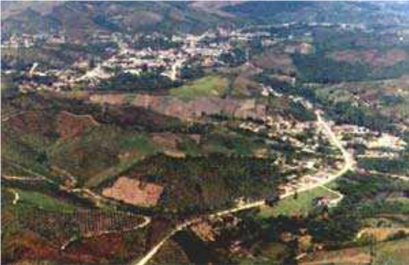
IMAGEM DO MUNICÍPIO