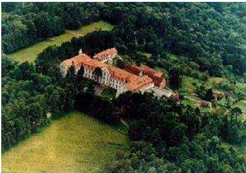
IMAGEM DO MUNICÍPIO