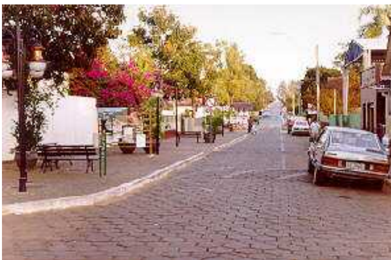
IMAGEM DO MUNICÍPIO

NOTA: Posição dos dados, no site da fonte, agosto de 2018.