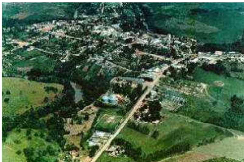
IMAGEM DO MUNICÍPIO