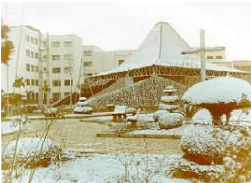
IMAGEM DO MUNICÍPIO