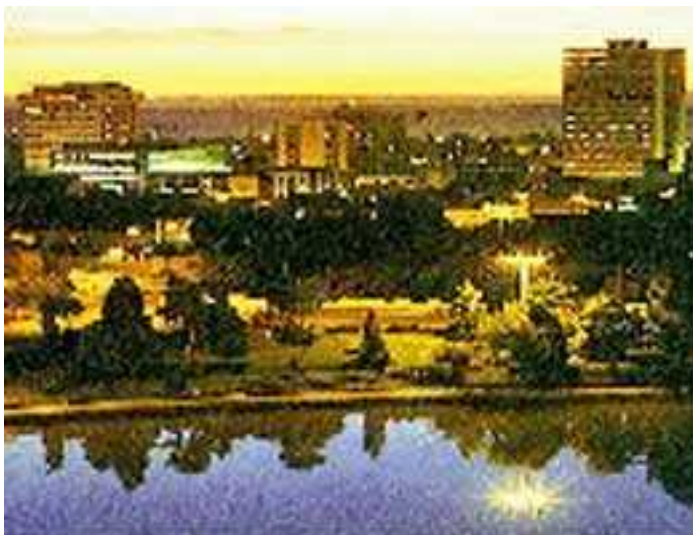
IMAGEM DO MUNICÍPIO