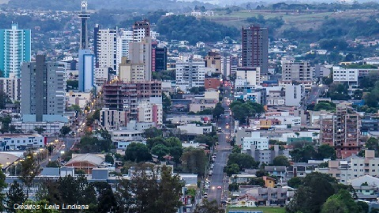
IMAGEM DO MUNICÍPIO