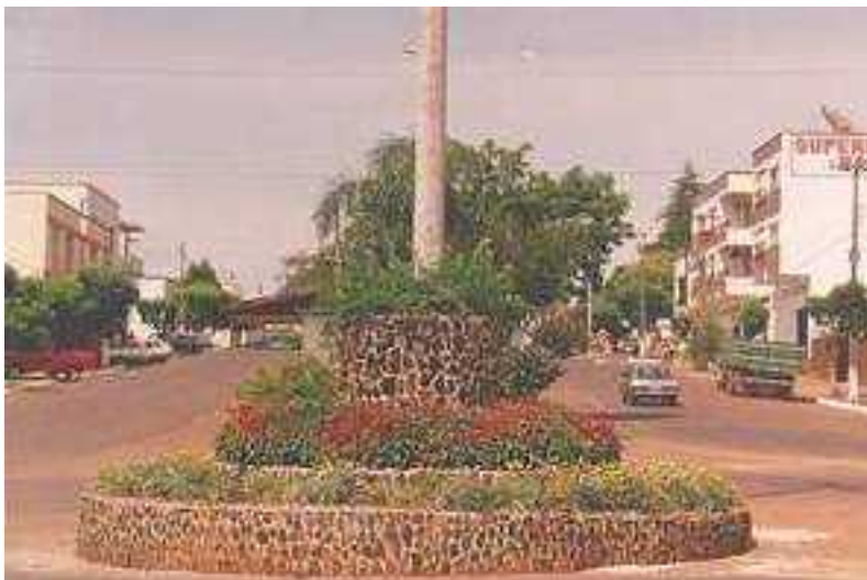
IMAGEM DO MUNICÍPIO