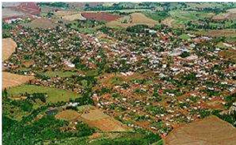
IMAGEM DO MUNICÍPIO