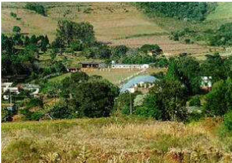
IMAGEM DO MUNICÍPIO