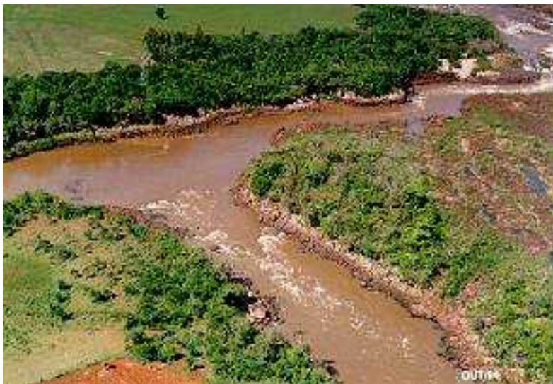
IMAGEM DO MUNICÍPIO