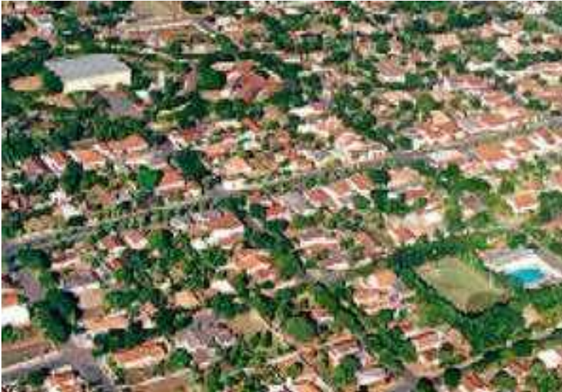
IMAGEM DO MUNICÍPIO