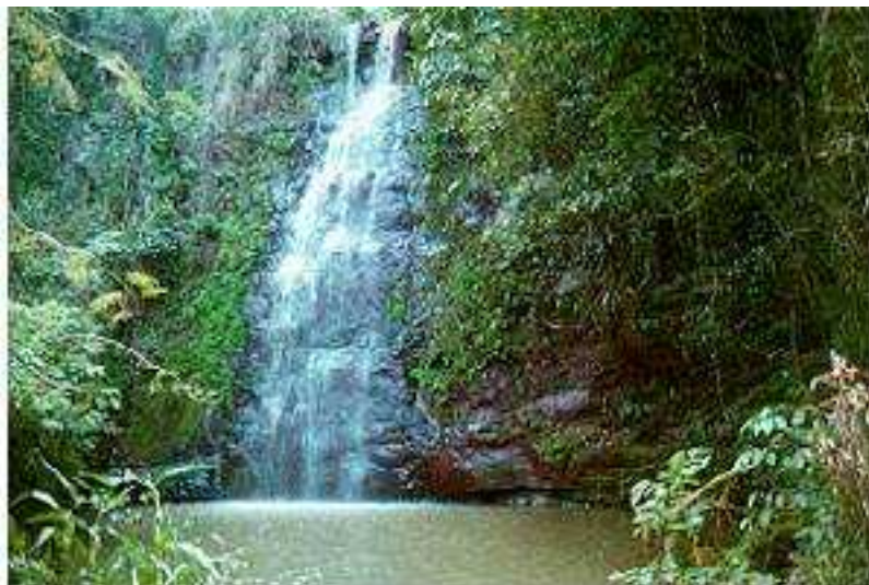
IMAGEM DO MUNICÍPIO