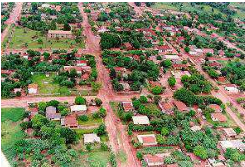
IMAGEM DO MUNICÍPIO