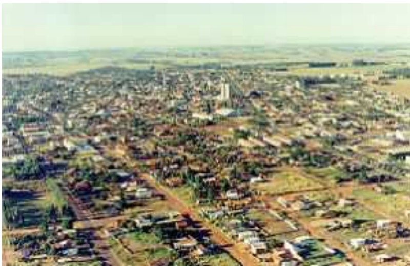
IMAGEM DO MUNICÍPIO