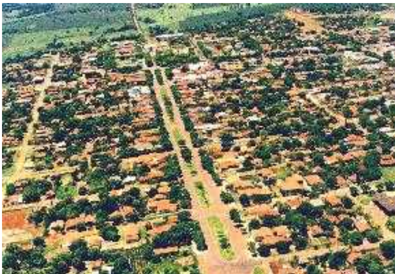
IMAGEM DO MUNICÍPIO