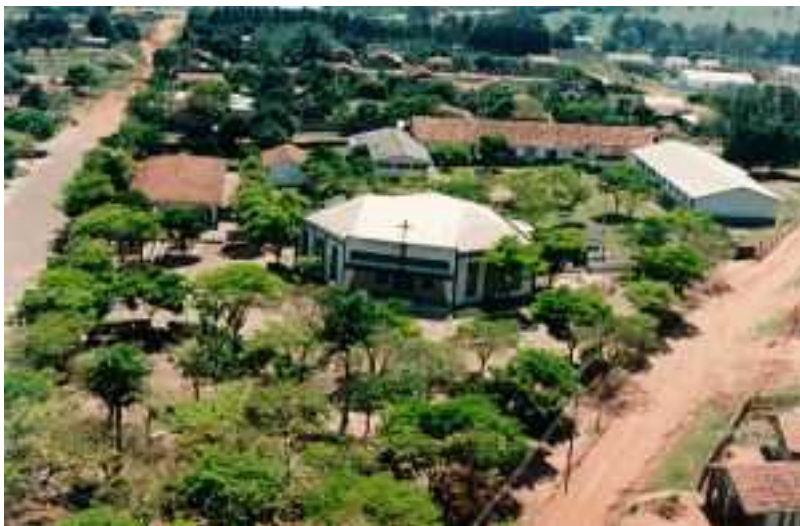
IMAGEM DO MUNICÍPIO