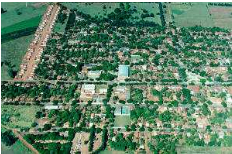
IMAGEM DO MUNICÍPIO