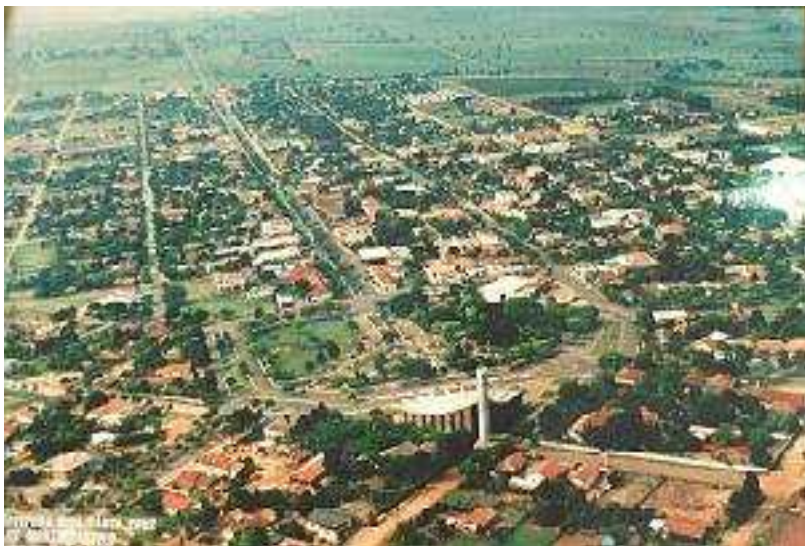
IMAGEM DO MUNICÍPIO