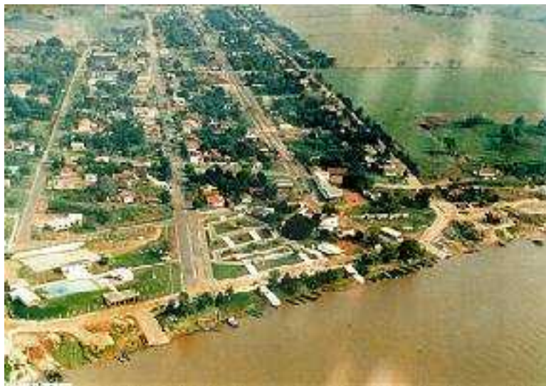
IMAGEM DO MUNICÍPIO